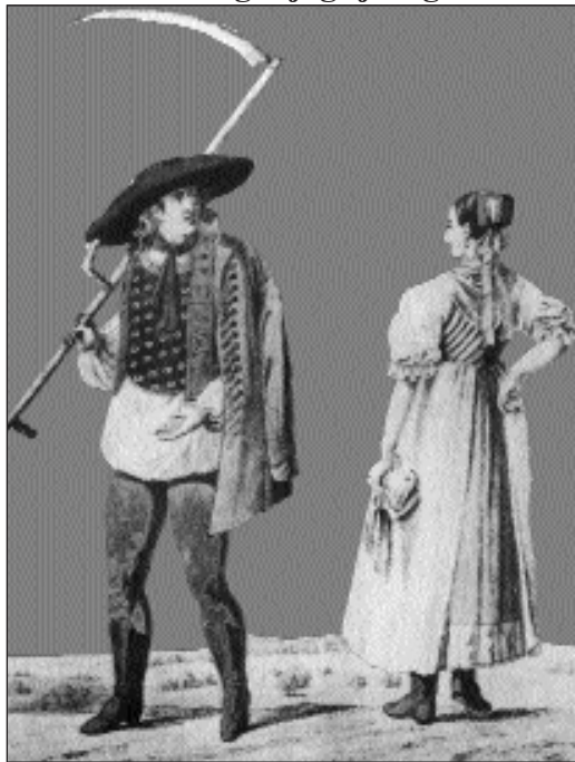
Kőszeg környéki „vizi horvát”.

III. A jobbágyság másik nagy csoportja az úgynevezett szegődményes jobbágy volt. Ezek a földesúrral magánjogi jellegű szerző-