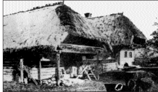
Kerített ház Szalafőn.

királyi kamara irányítását természetesen elfogadták és lojális alattvalók lettek, de a lojalitásuk ellenértékét nem kapták meg.